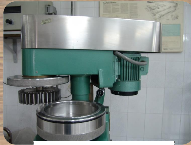
دستگاه پالایشگر خمیر کاغذ