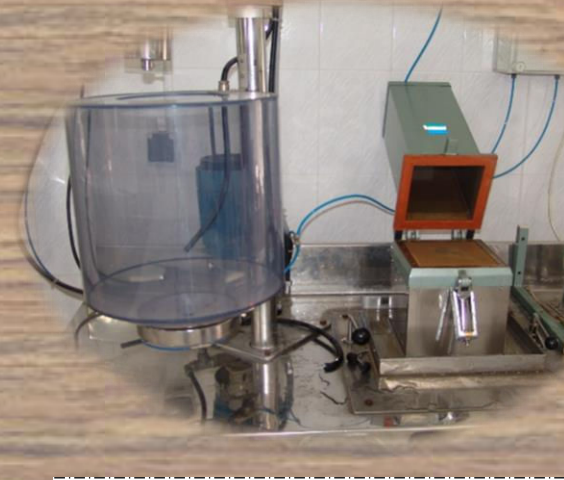
دستگاه ساخت کاغذ آزمایشگاهی