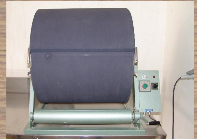
دستگاه خشک کن کاغذ