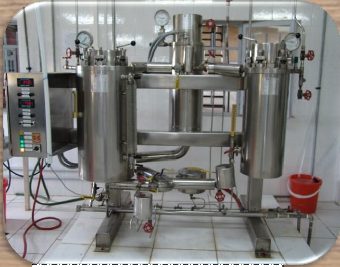
دیگ پخت گردش مایع پخت