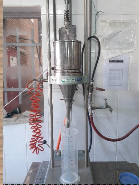
اندازه گیری درجه روانی خمیر کاغذ