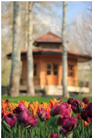
لاله‌های زیبای باغ گیاه‌شناسی ملی ایران