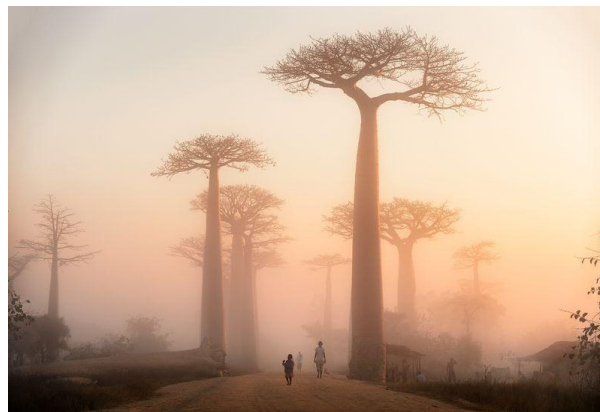
خورشید در حال طلوع بر بالای خیابان باتوباب ها در شهر Morondava ماداگاسکار