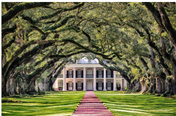
مزرعه کوچه بلوط (Oak Alley Plantation) در Vacherie, Louisiana (آمریکا)